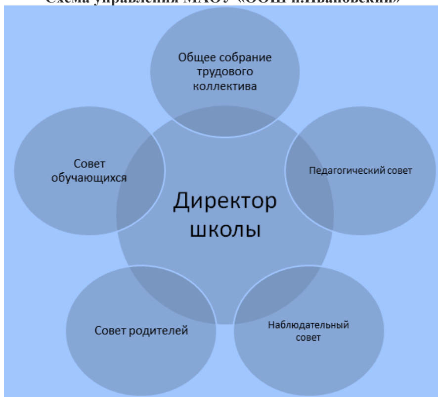
Схема управления МАОУ «ООШ п.Ивановский»

С целью улучшения в Учреждении отношений в сфере образования и дополнительного привлечения внебюджетных финансовых ресурсов могут создаваться на добровольной основе самоуправляемые некоммерческие объединения (фонды, советы), сформированные по инициативе родителей обучающихся и других граждан.